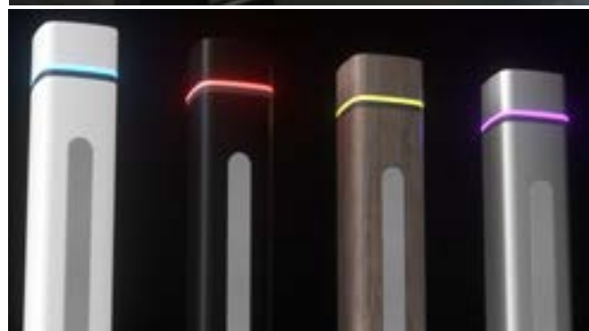
Múltiples opciones de personalización