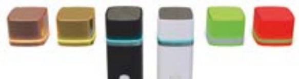
Tapas con diferentes colores